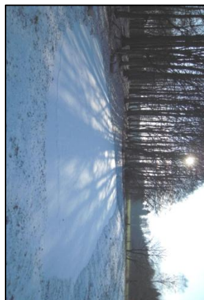
Neues Kleingewässer am Rande unseres „Fiedermanswäldes“ im ersten Winter – in Zukunft neuer Lebensraum für eine Vielzahl von Tieren und Pflanzen.