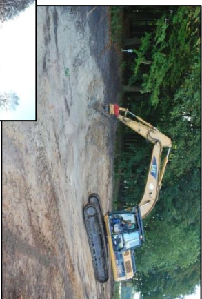
Schweres Gerät im Einsatz für den Naturschutz: Neuanlage eines Kleingewässers.