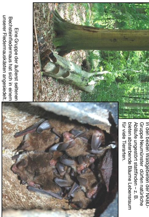
Eine Gruppe der äußerst seltenen Bechsteinfledermaus hat sich in einem unserer Fledermauskästen angesiedelt.